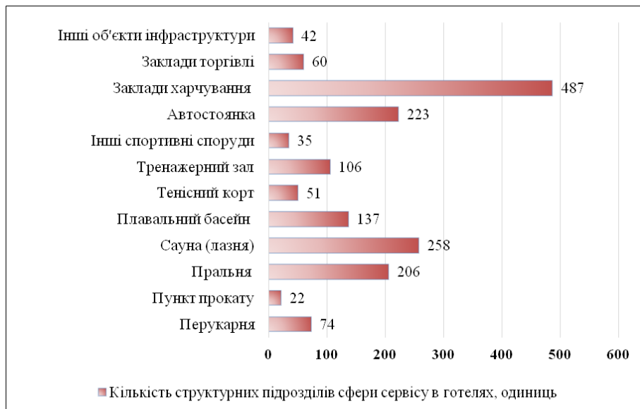
Рис. 2 Розподіл кількості структурних підрозділів сфери сервісу готелів в Україні у 2017 році

На рис. 2 видно, що українські готелі мають низьку забезпеченість як видами, так і за кількістю додаткових послуг. Найбільша кількість готелів має заклади харчування (ресторани, кафе та бари), а саме, 487 одиниць. Враховуючи те, що в 2017 році кількість готелів в Україні склала 1704 одиниць, тільки 30% з них мають власні заклади харчування. Серед загальної кількості тільки 13% готелів мають власні автостоянку та пральню, 8% мають басейн та інші послуги, пов'язані з фізичним навантаженням. У готельному господарстві велике значення приділяється сервісу – системі заходів, що забезпечують високий рівень комфорту та задоволення найрізноманітніших побутових, господарських, культурних потреб гостей за умови передбачуваного та професійного обслуговування. Загалом у світі нараховується біля 300 додаткових послуг у готелях [1]. Нажаль, українські готелі поки що не мають достатню кількість послуг, що суттєво заважає розвитку готельної індустрії країни.