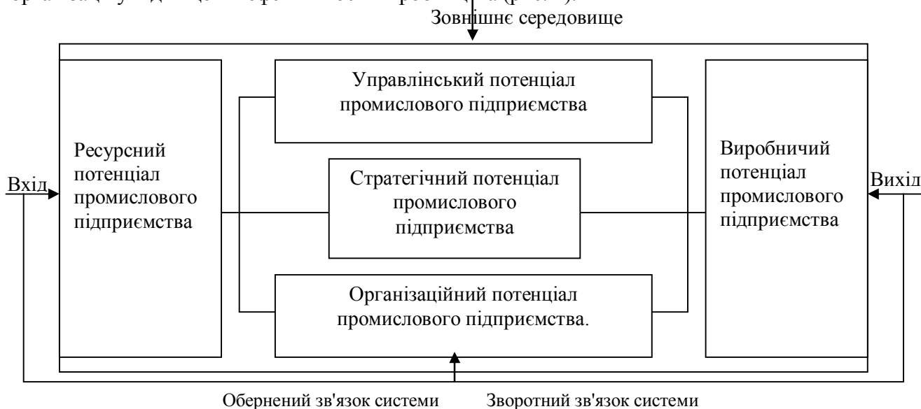
Рис. 1. Система корпоративного портфелю потенціалу промислового підприємства

Формування корпоративного портфелю потенціалу промислового підприємства необхідно за умовами концентрації основного капіталу, акумулювання ресурсів та реалізації інвестиційно-інноваційних проектів в моделі нової економіки. Система корпоративного