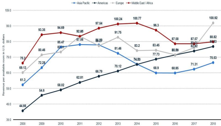
Рис. 3. RevPAR світової готельної індустрії за 2008-2018 рр. за регіонами [9]

Важливо дуже уважно стежити за тим, як RevPAR змінюється. Цей показник визначає, наскільки добре працює бізнес. В ідеалі RevPAR повинен постійно зростати (рис. 3).