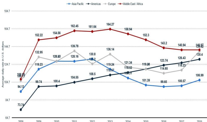
Рис. 2. ADR світової готельної індустрії за 2008-2018 рр. за регіонами [9]