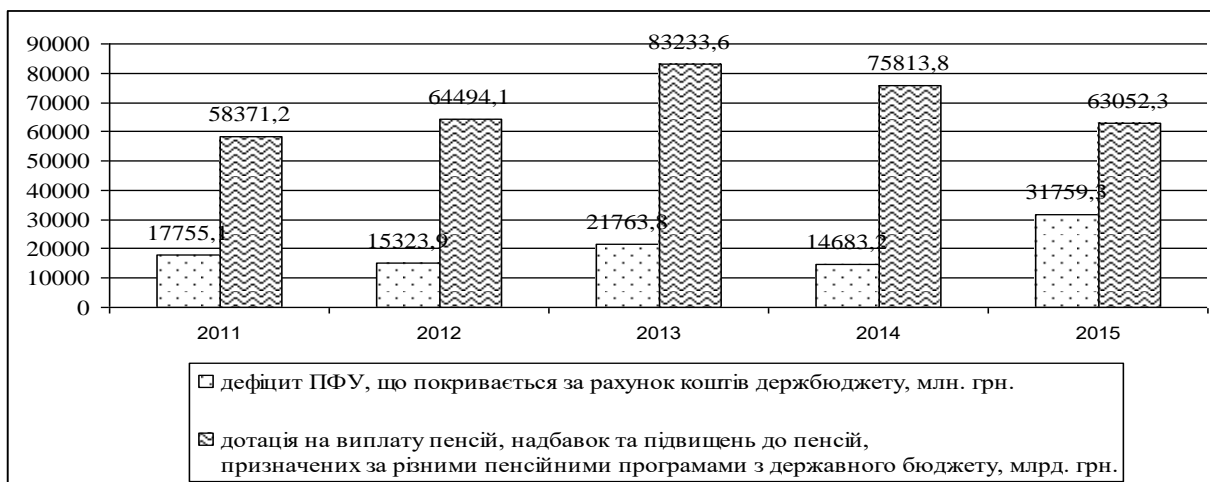
Рис. 2. Динаміка обсягів дефіциту ПФУ та дотацій на виплату пенсій, що фінансуються з державного бюджету протягом 2011-2015 років

Джерело: складено автором за даними річних звітів ПФУ[3]