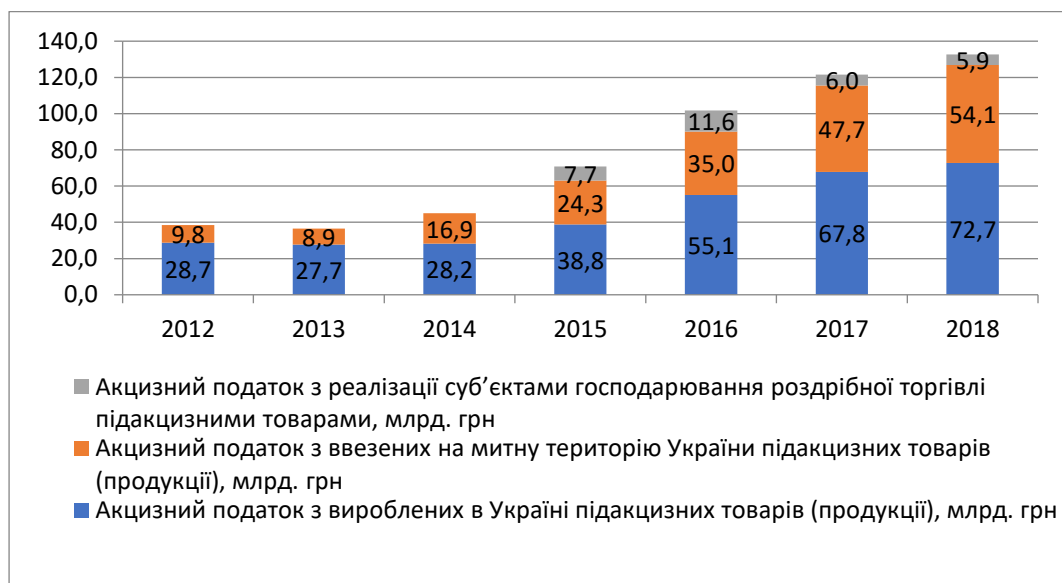
Рис. 2. Структура надходжень акцизного податку до Зведеного бюджету України, 2012-2018 рр., млрд. грн [1].

Збільшення надходжень акцизного податку за аналізований період обумовлено: стабільним зростанням ставок акцизного податку на всі види підакцизних товарів; розширенням переліку підакцизної продукції. Відмітимо, що номінальні надходження акцизного податку до зведеного бюджету України збільшились за досліджуваний період майже в 3,5 рази, у той час, як реальні надходження – лише в 1,43 рази.