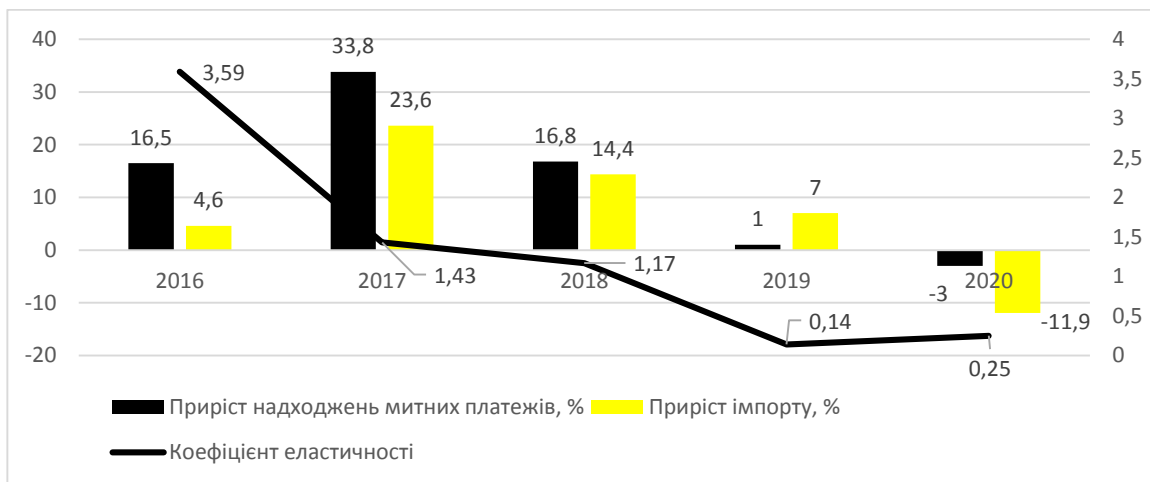
Рис. 1. Динаміка коефіцієнта еластичності митних платежів в Україні (розраховано авторками на основі [3])

платежів. Трендовий аналіз спрямований на порівняння досліджуваного показника з низкою періодів, що передують, і визначення тренду – основної тенденції динаміки показника, очищеної від випадкових впливів окремих факторів.