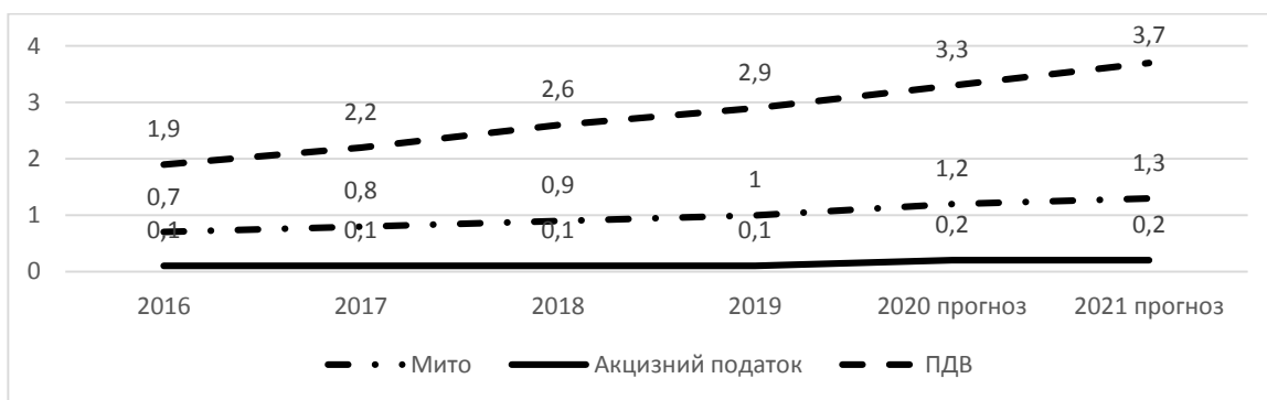
Рис. 4. Податкові втрати бюджету України через існування контрабандних схем, млрд. дол. США [7]

Розраховані обсяги контрабандних поставок в Україну в середньому складають $10,6 млрд. на рік або 8,7 % ВВП. Базуючись на побудованій регресії «обсяги імпорту України – ВВП» та «контрабандні поставки – ВВП», фахівцями київської незалежної групи з макроекономічного аналізу та прогнозу було розраховано прогнозні обсяги контрабандних поставок в Україну у 2021 р. – 17,2 млрд. дол. США. І потенційне фіскальне навантаження на контрабанду складає 30,37 % [7]. Прямі податкові втрати бюджету через існування контрабандних схем наведено на рис. 4.