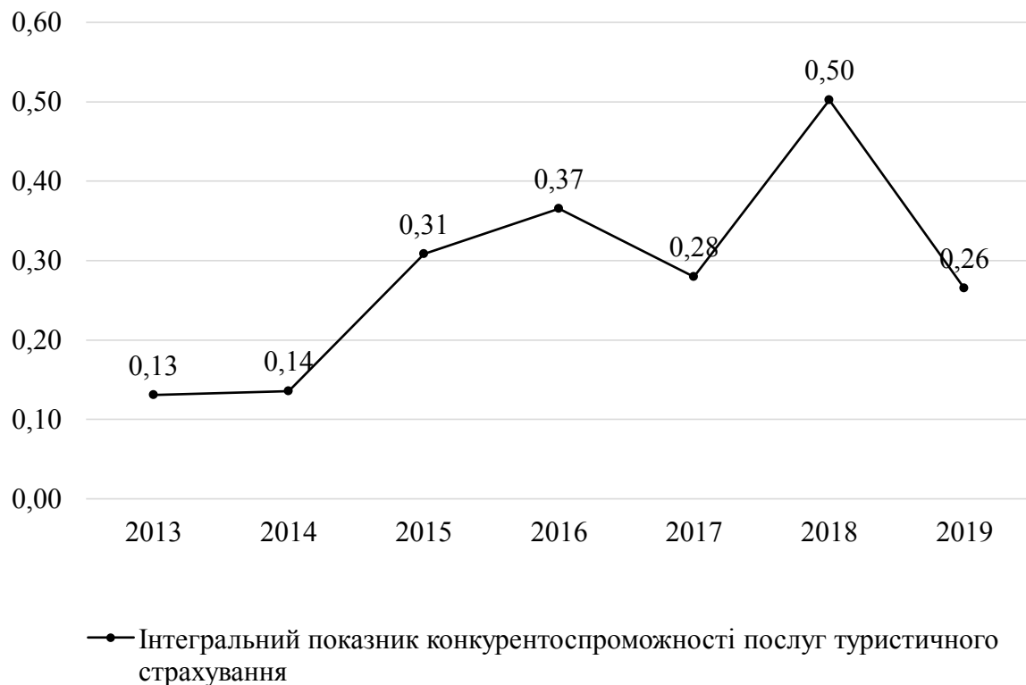
Рис. 2. Тенденції зміни інтегрального показника конкурентоспроможності послуг міжнародного туристичного страхування

Як представлено на рис. 2, найбільшого значення інтегральний показник конкурентоспроможності послуг міжнародного туристичного страхування досягнув у 2018 році переважно за рахунок високих темпів зростання обсягу валових страхових премій та зниження частки 10 перших страховиків на ринку послуг туристичного страхування, що характеризує ступінь його монополізації. Втім, у 2019 році відбувся спад цих показників, а відповідно й інтегрального показника конкурентоспроможності. Зростання рівня конкуренції у галузі є позитивним фактором, який стимулює страхові компанії підвищувати якість послуг та пропонувати більш привабливі умови страхування для споживачів.