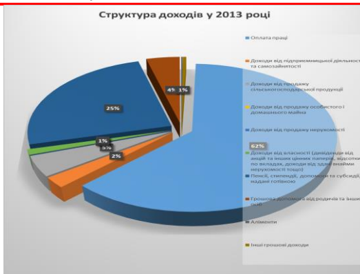
Рис.1. Структура доходів населення Одеської області у 2013 році.