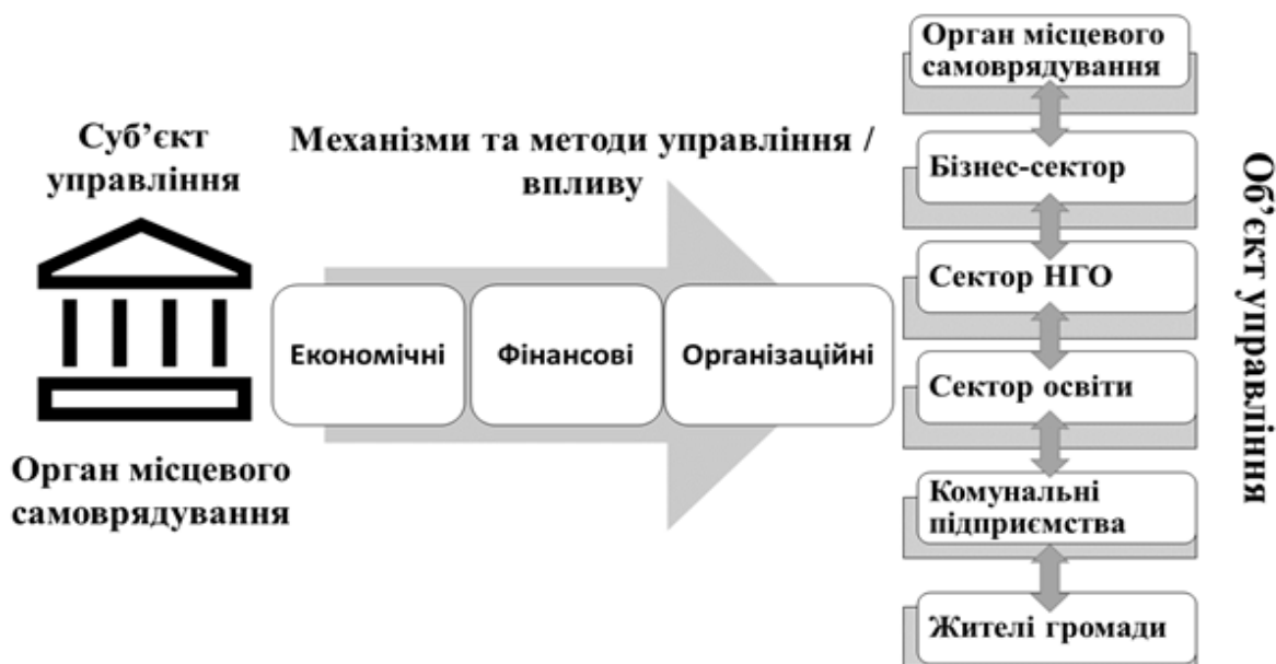
Рис. 1. Система управління економічним розвитком громади в умовах МЕР

Аналізуючи дані визначення, ми можемо зробити висновок про те, що насправді концепція МЕР є своєрідною оболонкою – «framework» - яка формує певну управлінську систему, покликану забезпечити соціально-економічний розвиток (рис. 1).