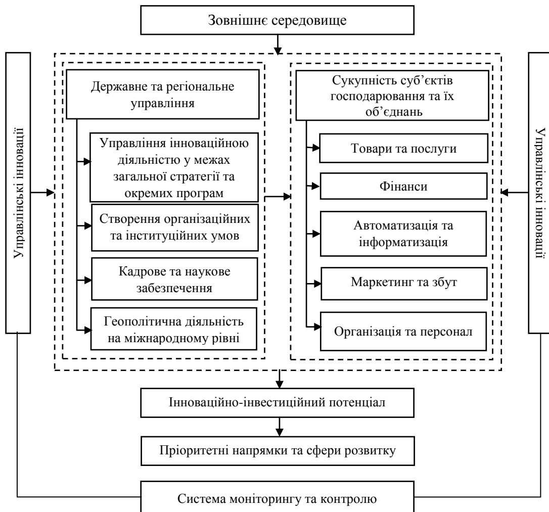
Рис. 3. Модель управління інноваційним розвитком національної економіки

У процесі інноваційного розвитку система знаходиться під впливом зовнішнього середовища. До найбільш значущих чинників зовнішнього середовища доцільно віднести загальний геополітичний та економічний стан і перспективи розвитку економіки країни, державну інноваційну політику, інвестиційну привабливість, перспективи розвитку окремих галузей.