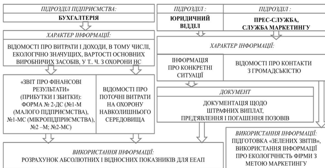
Рис. 4. Інформаційні джерела для розрахунків: форми фінансової звітності та додаткова інформація про конкретні ситуації

Необхідно зауважити, що окрім форм звітності, зазначених на рис. 4, потрібну інформацію, що безпосередньо стосуються і екологічної складової фінансових звітів, також зазначено в таких документах: «Баланс», форма № 1 (квартальна); «Звіт про фінансові результати», форма № 2 (квартальна); «Звіт про використання та запаси палива», форма № 4-мп (місячна); «Звіт про обсяги реалізованих послуг», форма № 1-послуги (квартальна); «Звіт про капітальні інвестиції», форма № 2-інвестиції (квартальна), а також: «Обстеження ділової активності промислового підприємства», «Обстеження ділової активності промислового підприємства (інвестиції)» тощо [13]. Отже, під час ретельного обстеження діяльності суб'єкта господарювання необхідно зустрітися з топ-менеджерами підприємства, керівниками підрозділів, здійснити огляд промислових приміщень, звертаючи увагу на стан обладнання, умови зберігання сировинних запасів та дуже ретельно вивчити звітність підприємства.