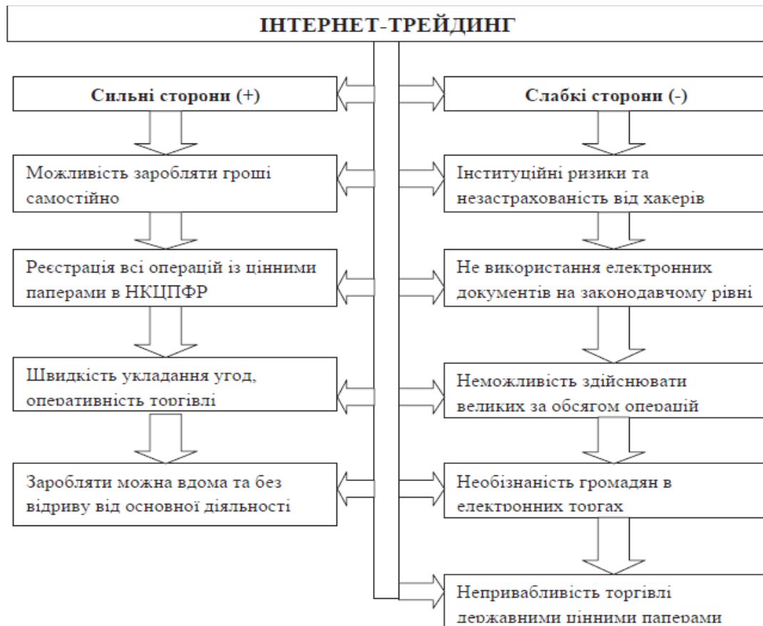
Рис. 2 Позитивні та негативні риси використання Інтернет-трейдингу на фінансовому ринку [2]

Інтернет-трейдинг (англ. Internet-Trading) є способом доступу до торгів на валютній, фондовій та товарній біржах з використанням Інтернету як засобу зв'язку [1]. Вітчизняними вченими було розглянуто позитивні та негативні риси використання Інтернет-трейдингу (рис.2.) [2].