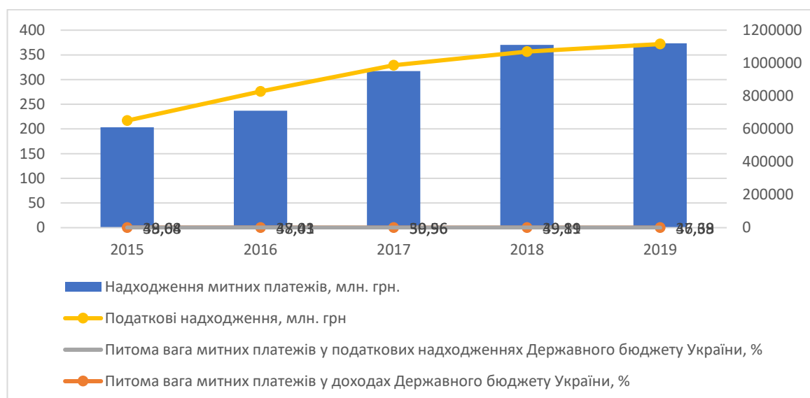
Рис. 1. Динаміка надходжень митних платежів, їх питомої ваги у податкових надходженнях, доходах Державного бюджету України, 2015-2019 рр. [1]

Митні платежі виступають важливим джерелом формування доходів Державного бюджету України та відіграють суттєву роль як у податкових надходженнях, так і загальній сумі доходів Державного бюджету України (рис. 1).