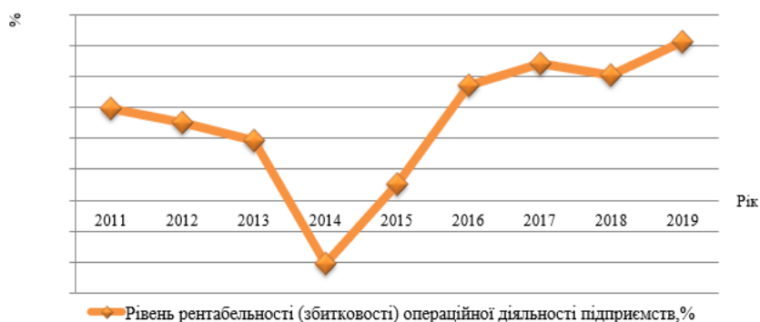
Рис. 2 Рівень рентабельності операційної діяльності підприємств України у 2011 – 2019 рр. складено автором за даними [9]

Як бачимо, рівень рентабельності операційної діяльності підприємств України у 2019 році значно кращий ніж у 2011 році, що свідчить про значний прогрес у нарощування прибутку підприємствами України за рахунок операційної діяльності. У 2019 році вона складала 10,2%, що на 4,3 п. п. більше ніж у 2011 році. Та на 2,1 п.п. більше ніж за минулий рік. Протягом аналізованого періоду лише у 2014 році рентабельність була від'ємною (-4.1%). Тобто збитки від операційної діяльності перевищували отримані прибутки.