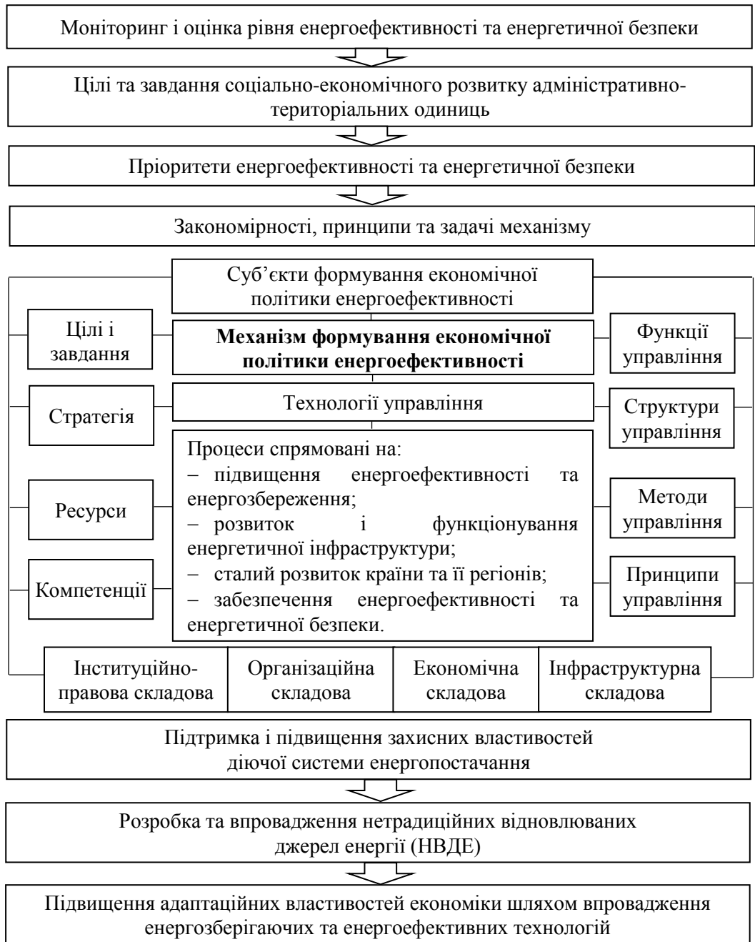
Рис. 2. Механізм формування економічної політики енергоефективності