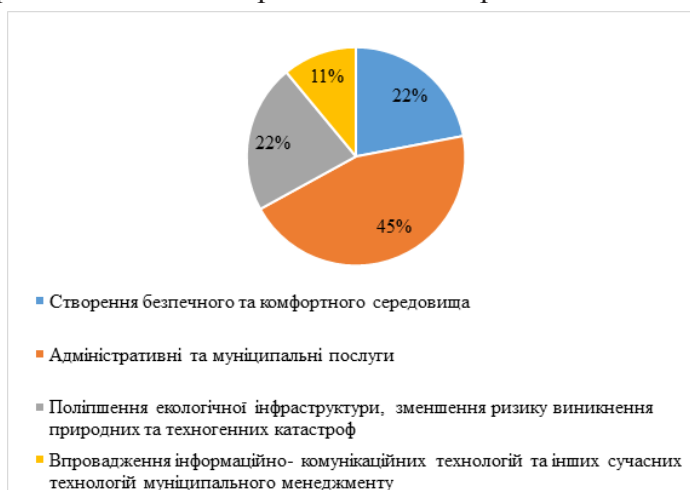
Рис. 1. Розподіл договорів співробітництва територіальних громад за сферами, укладених між громадами протягом 2017-2022 років*

В межах проєкту USAID «ГОВЕРЛА», до якого залучені Міжгірська селищна територіальна громада, Полянська сільська територіальна громада, Ясінянська селищна територіальна громада ведеться активна робота щодо укладання договорів про співробітництво та реалізацію спільних проєктів. Розподіл договорів співробітництва в розрізі сфер діяльності по роках ініціювання та складання договорів співробітництва громад по сферам, укладених між громадами протягом 2017-2022 років подано на рис. 1.