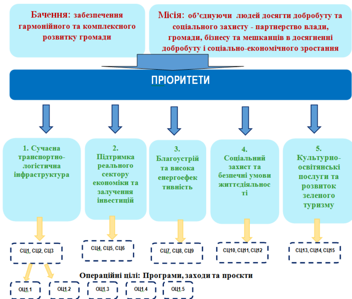
Рис. 2 «Дерево цілей» реалізації Стратегії економічного і соціального розвитку громади