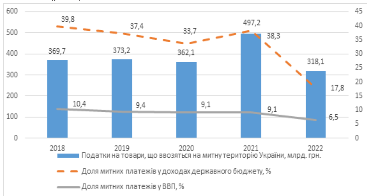
Рис. 1. Фіскальна значимість митних платежів з ввезених в Україну товарів у 2018-2022 рр.

Основний матеріал. Імпорт є одним з поширених митних режимів, який пов'язаний з купівлею українськими суб'єктами зовнішньоекономічної діяльності (ЗЕД) в іноземних суб'єктів господарської діяльності товарів з ввезенням їх на територію України зі сплатою податків та зборів при митному оформленні та контролі. Податки, які сплачуються при здійсненні розмитнення імпортованих на митну територію України товарів, складають доволі велику величину – більше третини доходів державного бюджету 2018-2021 рр. та 9-10 % ВВП (рис. 1).