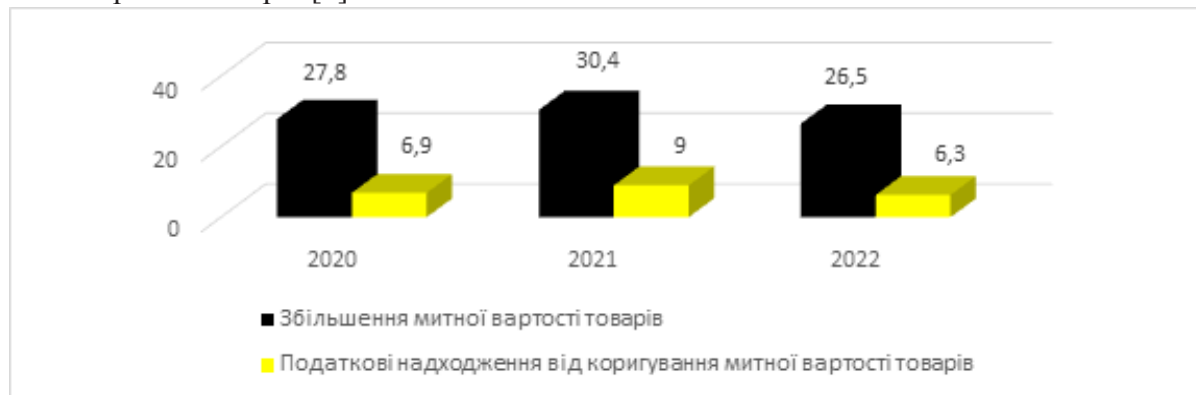
Рис. 3. Результати роботи Державної митної служби України за правильністю визначення суб'єктами ЗЕД митної вартості імпортованих товарів, млрд. грн.

Лише за січень 2023 р. митними аудиторами виявлено 76 фактів порушень митного законодавства орієнтовно на суму 20 млн. грн., 25 % з яких пов'язано з не підтвердженням митної вартості товарів [5].