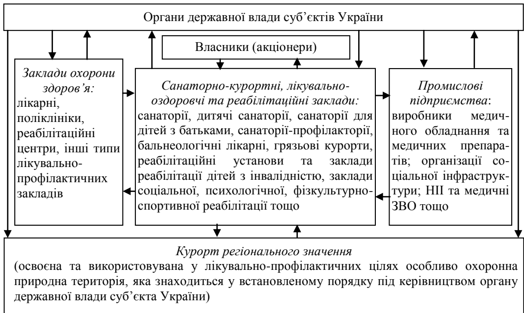
Рис. 1. Структурована схема управління санаторно-курортною, лікувально-оздоровчою та реабілітаційною системою регіону

забезпечення виконання послуг; якість послуг; кваліфікація персоналу; обліково-звітна документація; інформаційні технології.