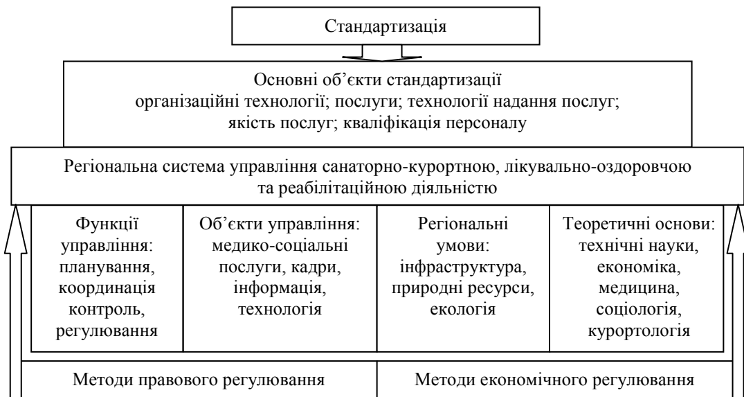
Рис. 2. Методологія управління санаторно-курортною, лікувально-оздоровчою та реабілітаційною системою регіону