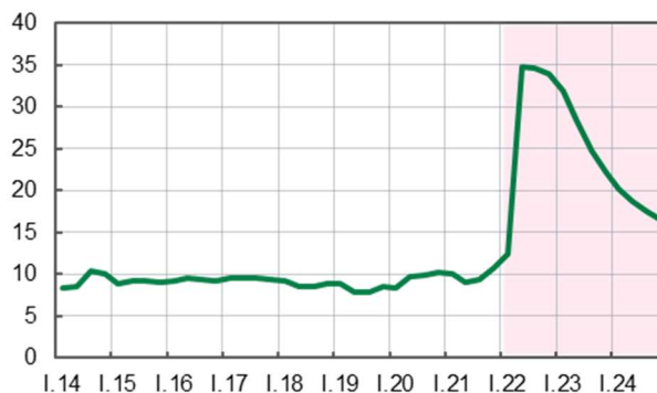
Рис. 2. Рівень безробіття за методологією МОП, % [7]

Окремо слід звернути увагу на фактор безробіття, пов'язаний з втратою роботи у частини населення. Причинами таких тенденцій могли стати як вимушена міграція, так і консервування роботи об'єктів. Відповідно до прогнозів та оцінок, що їх наводить НБУ у липневому інфляційному звіті за 2022 рік, рівень безробіття зріз до 35% (Рис. 2.).