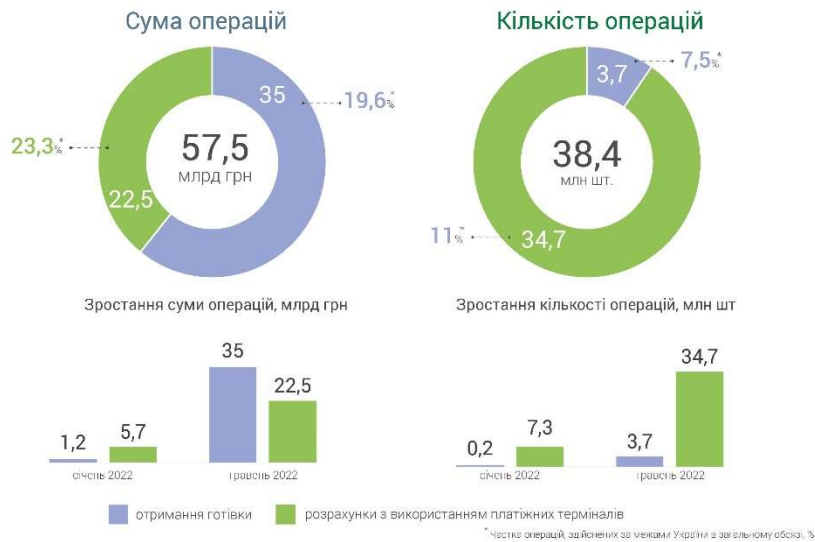
Рис. 3. Операції з картами українських банків за кордоном за травень 2022 р. [11]

даними НБУ, становила 57,5 млрд грн., на противагу – у січні 2022 р. – близько 7 млрд грн. (Рис. 3).