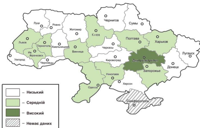
Рис. 3. Картограма регіонів України за рівнем розвитку бізнесу у 2020 році