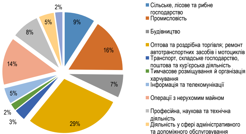
Рис.2 Структура кількості підприємств за видами економічної діяльності

Це зумовлюється як вигідним економіко-географічним положенням так і достатньо багатим набором власних сировинних ресурсів. Ці ресурси дозволяють розвивати паливно-енергетичну, хімічну промисловість, скляне й фарфоро-фаянсове виробництво, виробництво будматеріалів.