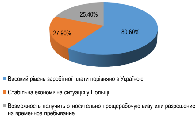
Рис. 3. Переваги роботи у Польщі для українців

Згідно з соціологічним опитуванням, українські трудові мігранти планують у 2021 році активніше інтегруватися в Польщі, а також зростає і частка безповоротної міграції. Дослідження показує, як і минулого року, стабільну тенденцію виїзду з України молодого, працездатного населення – віком до 39 років. За рік спостерігається помірна тенденція до збільшення частки жінок у гендерній структурі трудової міграції (порівняно з 2020 роком – збільшення на 3%). У більшості респондентів або вища (28,4%), або професійно-технічна або середня спеціальна освіта (47,8%). Основні три переваги роботи в Польщі для українців були і залишаються економічними