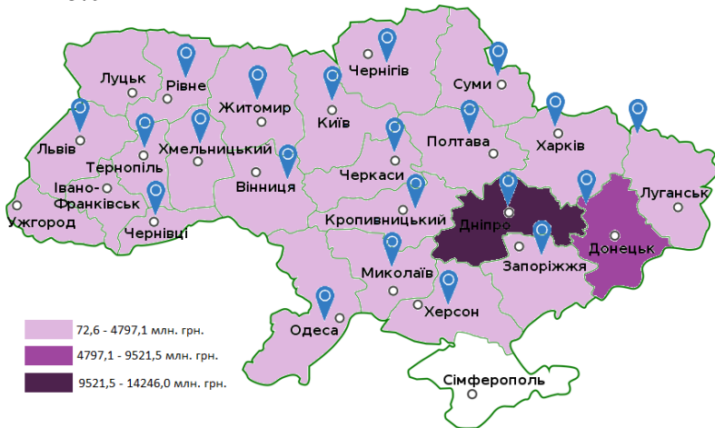
Рис. 4. Картограма розподілу регіонів України за загальними інвестиціями на охорону навколишнього середовища у 2020 році

Отже, за отриманими результатами можна зробити висновок, що у 2020 році в середньому обсяг загальних інвестицій на охорону навколишнього середовища серед регіонів України склав 3025,4 млн. грн. При цьому у більшості регіонів України загальний обсяг інвестицій на охорону навколишнього середовища склав 2489,8 млн. грн. Також стало ясно, що у половини регіонів загальний обсяг інвестицій на охорону навколишнього середовища склав менше, ніж 2649,6 млн. грн., а у іншій половині – більше. У 25% регіонів загальний обсяг інвестицій на охорону навколишнього середовища склав менше, ніж 1361,1 млн. грн., а у інших 75% – більше. І нарешті, у 75% регіонів загальний обсяг інвестицій на охорону навколишнього середовища склав менше, ніж 3938,1 млн. грн., а у інших 25% - більше.