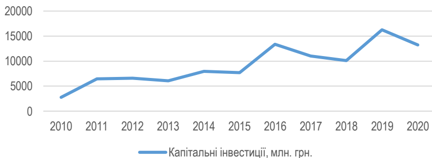
Рис. 1. Динаміка капітальних інвестицій на охорону навколишнього природного середовища за 2010-2020 рр. в Україні, млн. грн.

Зобразимо на рисунку 1 динаміку капітальних інвестицій за 2010-2020 рр. на охорону навколишнього природного середовища в цілому по Україні. Аналізуючи отриманий графік, можна сказати, що у 2020 році порівняно з 2019 роком обсяг капітальних інвестицій на охорону навколишнього природного середовища в Україні зменшився на 3,016 млрд. грн. або на 18,6%, а порівняно з 2010 роком обсяг капітальних інвестицій на охорону навколишнього природного середовища збільшився на 10,478 млрд. грн. або в 4,8 рази.