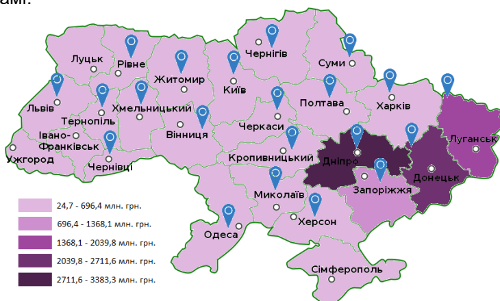
Рис. 3. Картограма розподілу регіонів України за загальними інвестиціями на охорону навколишнього середовища у 2010 році

Розрахувавши середнє значення, моду, медіану та кватртил можна зробити висновок, що у 2010 році в середньому обсяг загальних інвестицій на охорону навколишнього середовища серед регіонів України складав 629,2 млн. грн. При цьому у більшості регіонів України загальний обсяг інвестицій на охорону навколишнього середовища складав 368,7 млн. грн. Також стало ясно, що у половини регіонів загальний обсяг інвестицій на охорону навколишнього середовища складав менше, ніж 424,5 млн. грн., а у іншої половини – більше. У 25% регіонів загальний обсяг інвестицій на охорону навколишнього середовища складав менше, ніж 224,6 млн. грн., а у інших 75% – більше. І нарешті, у 75% регіонів загальний обсяг інвестицій на охорону навколишнього середовища складав менше, ніж 624,4 млн. грн., а у інших 25% – більше. Представимо отримане групування на картограмі.