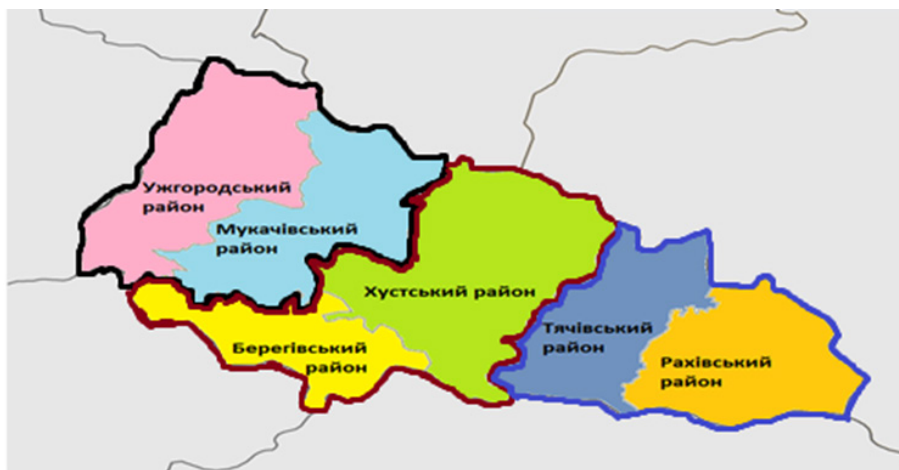
Рис. 3. Групи адміністративних районів Закарпатської області з врахуванням фінансової диференціації