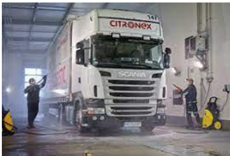
Рис. А.1 — Дільниця прибирально—мийних робіт на станції технічного обслуговування