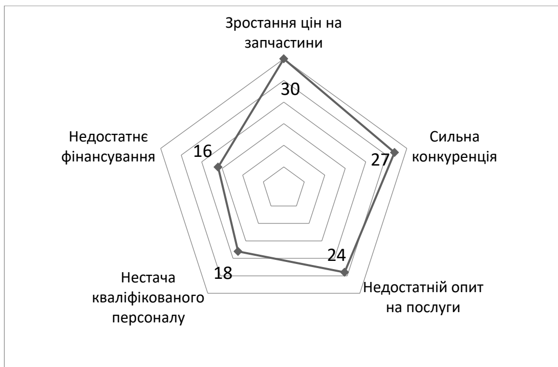
Рис. В.1. – Найбільші ризики для підприємства