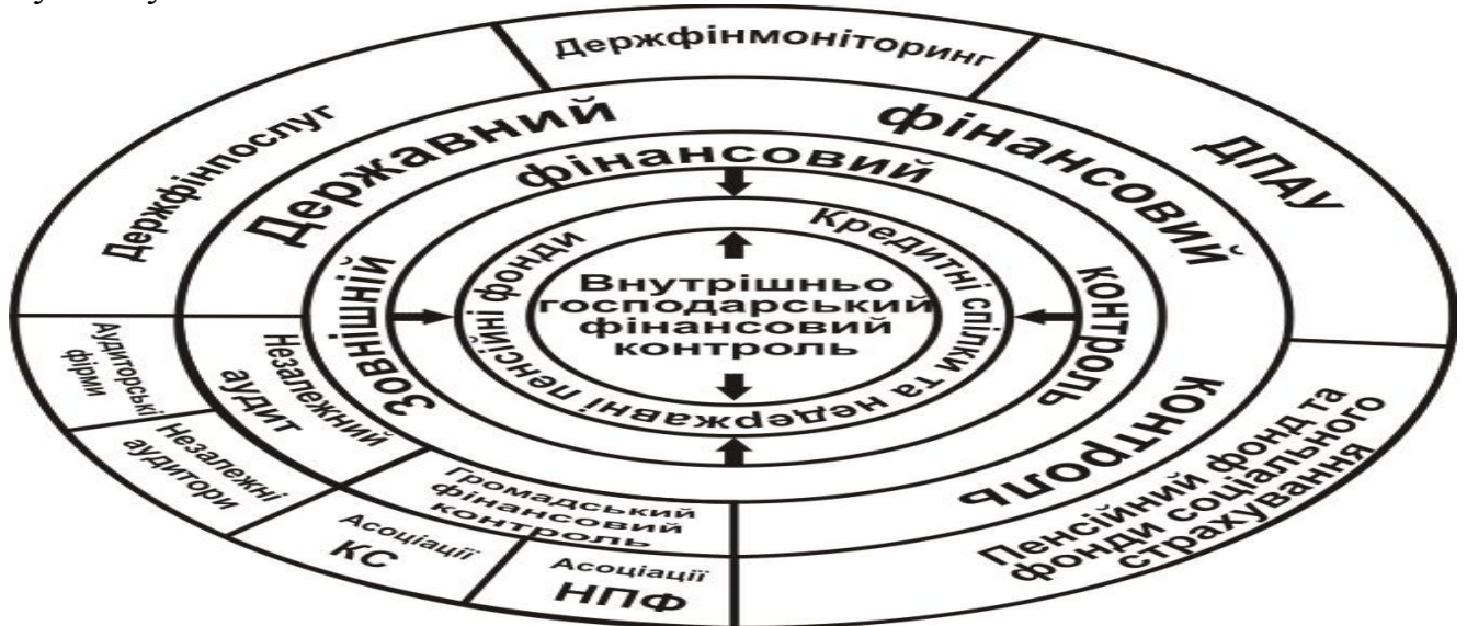
Рис. 2. Види фінансового контролю за інституційною ознакою

Зменшити та в кінцевому підсумку звести таку вірогідність до нуля покликаний фінансовий контроль, представлений в Україні рядом інституцій (рис. 2), основною метою діяльності яких є зміцнення фінансової дисципліни, забезпечення економії матеріальних, трудових і грошових ресурсів, а також повного, своєчасного та доцільного використання грошових коштів у суспільстві для досягнення ефективного результату.