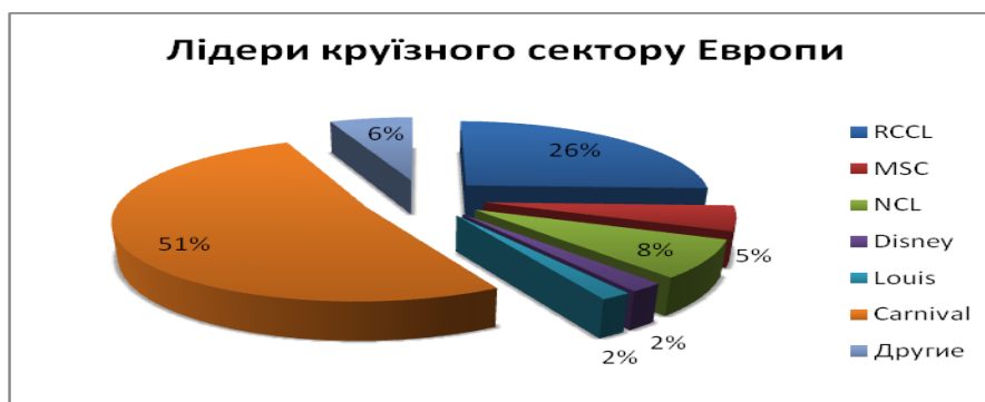
Рис. 1. Частка ринку круїзних операторів в Європейському регіоні, 2012

Як відомо, після розпаду СРСР, Україні дісталися 30 % власності торгового флоту, 18 морських і 8 річкових портів, судоремонтні і суднобудівельні заводи. Якщо на кінець 80-х років минулого століття на Кримсько-кавказькій круїзній лінії за рік перевозилося 2,1-2,5 млн. пасажирів (з яких 10-12 % склали іноземні громадяни), то в 2011 р. Одеську затоку