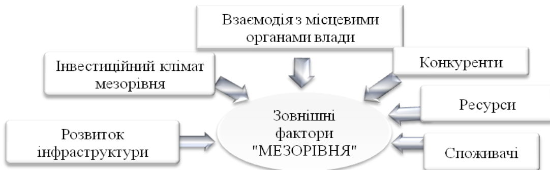
Рис. 2. Класифікація зовнішніх факторів конкурентоспроможності підприємства мезорівня

Доцільно проаналізувати більш докладно фактори мезорівня, які можна класифікувати як показано на рис. 2.