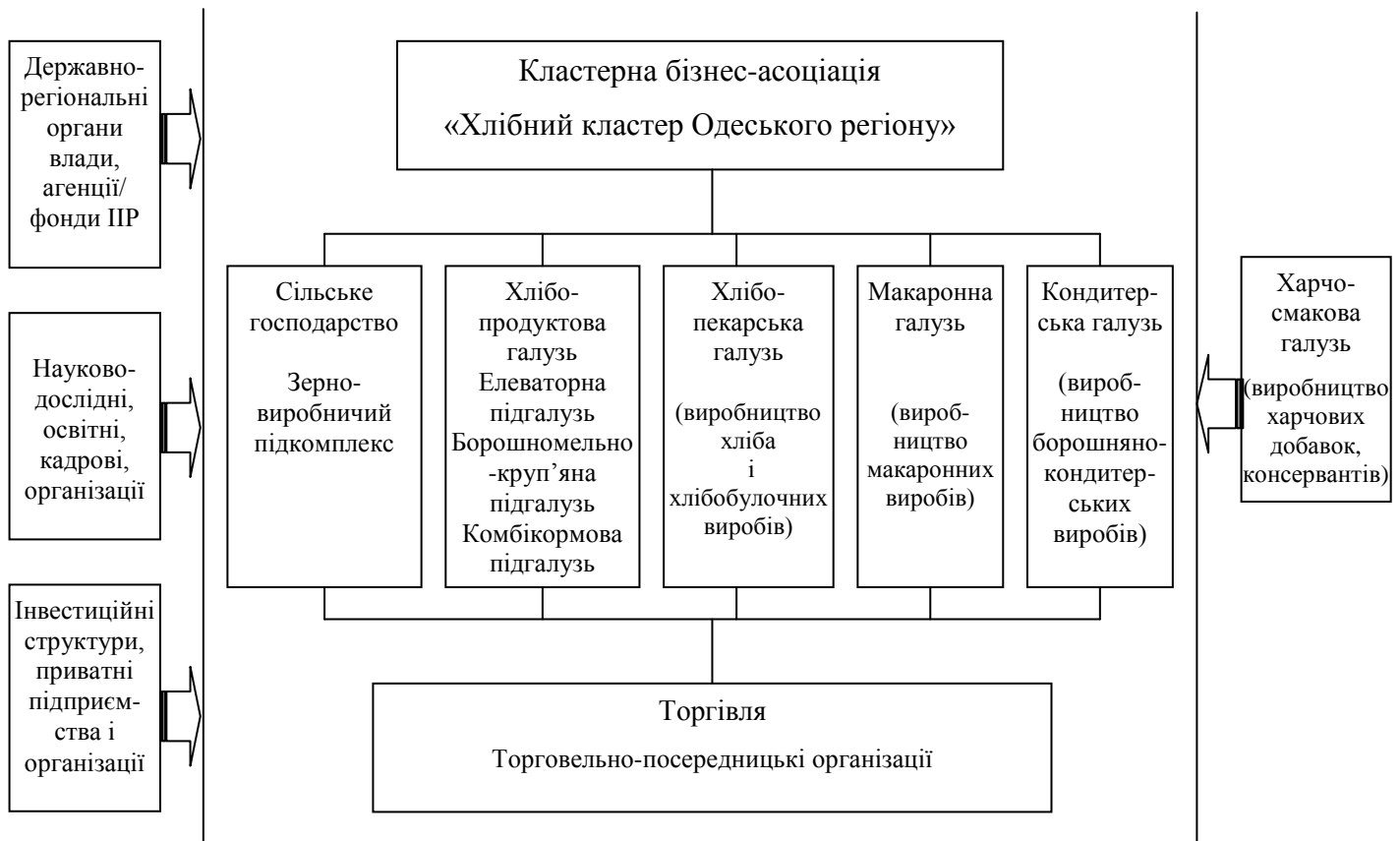
Рис. 1. Структурна модель кластерної бізнес-асоціації «Хлібний кластер Одеського регіону»

спрямовуватися до тих учасників кластера, впровадження інвестиційно-інноваційних процесів яких є доцільними з метою збільшення загальної ефективності всієї кластерної структури.