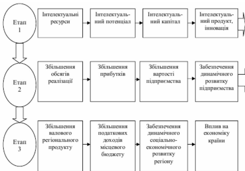
Рис. 1. Місце інтелектуального потенціалу у соціально-економічному розвитку регіону

Якісні характеристики інтелектуального потенціалу регіону формуються під впливом освіти. Ринкові трансформації суттєво знизили якість освітньої діяльності. Освіта пов'язана з надмірною комерціалізацією, особливо вища, яка в Україні скромно трактується як введення оплати за освітні послуги. Що стосується «контрактників», то навіть для державних навчальних закладів вони сьогодні є важливим джерелом їх існування. За таких умов вимоги до знань учнів і студентів стають другорядними у порівнянні з фінансовими потребами [6].