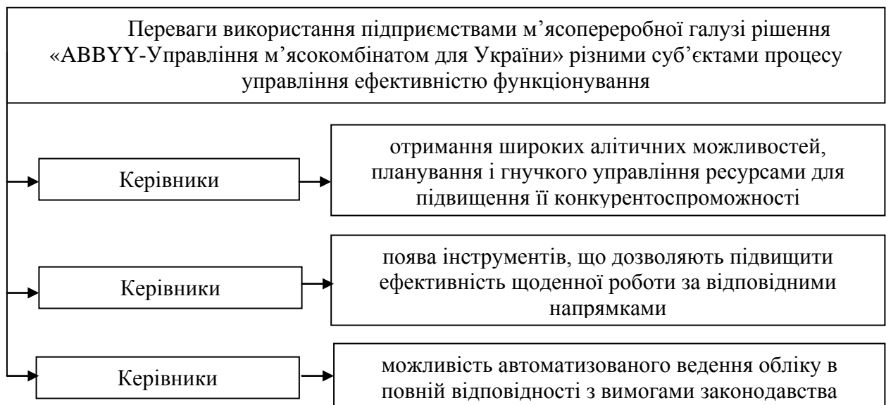
Рис. 4. Переваги використання підприємствами м'ясопереробної галузі рішення «АВВУУ-Управління м'ясокомбінатом для України» різними суб'єктами процесу управління ефективністю функціонування