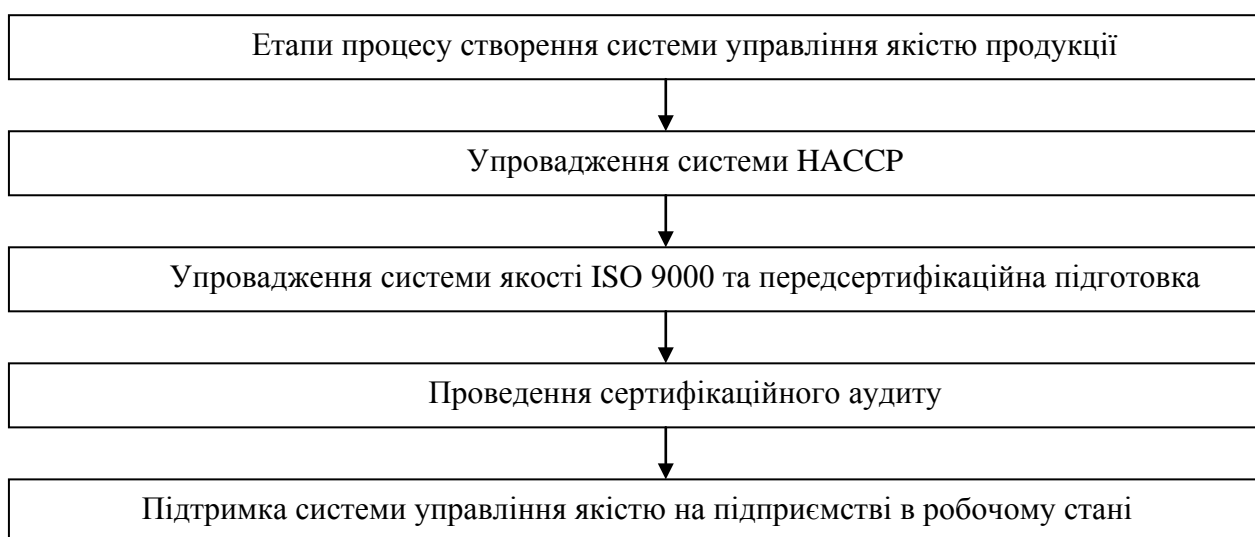
Рис. 2. Етапи процесу створення системи управління якістю продукції

Система HACCP є єдиною системою управління безпечністю харчової продукції, яка довела свою ефективність і прийнята міжнародними організаціями [2].