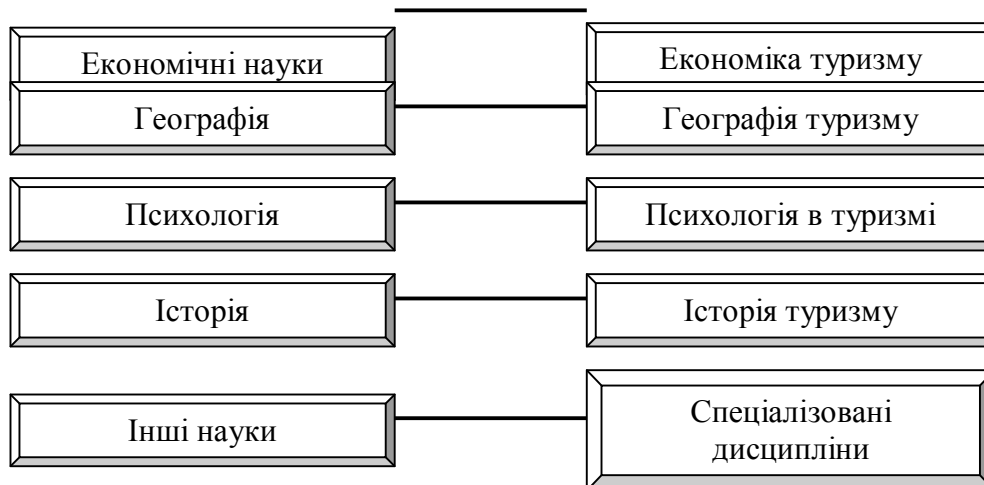
Рис. 1. Туризм як складова інших наук

Наочно цю тезу продемонстровано на рис. 1.