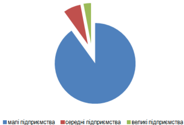
Рис. 2. Підприємства готельного господарства України за місткістю номерного фонду, %

Відомо, що в проектуванні й будівництві мотелів у нашій країні порівняно з країнами заходу помітна суттєва різниця. Насамперед це функціональне призначення самого мотелю. Якщо в країнах Заходу з високим ступенем автомобілізації мотель виконує здебільшого функцію придорожного мотелю і тільки в курортних місцевостях його використовують для потреб рекреації, то в нашій країні це заклади масового відпочинку, які використовують з рекреаційною метою незалежно від їх розміщення. Друга відмінність полягає в тому, що на будівництво таких закладів у країнах бізнесу нерідко впливають комерційні цілі, котрі покладено в основу цих або інших планувальних і просторових вирішень.