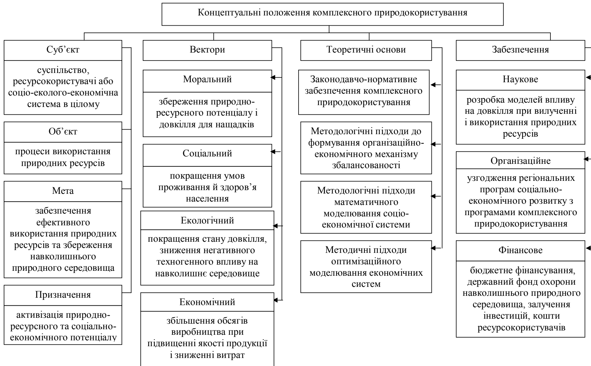
Рис. 2. Концептуальні положення комплексного природокористування