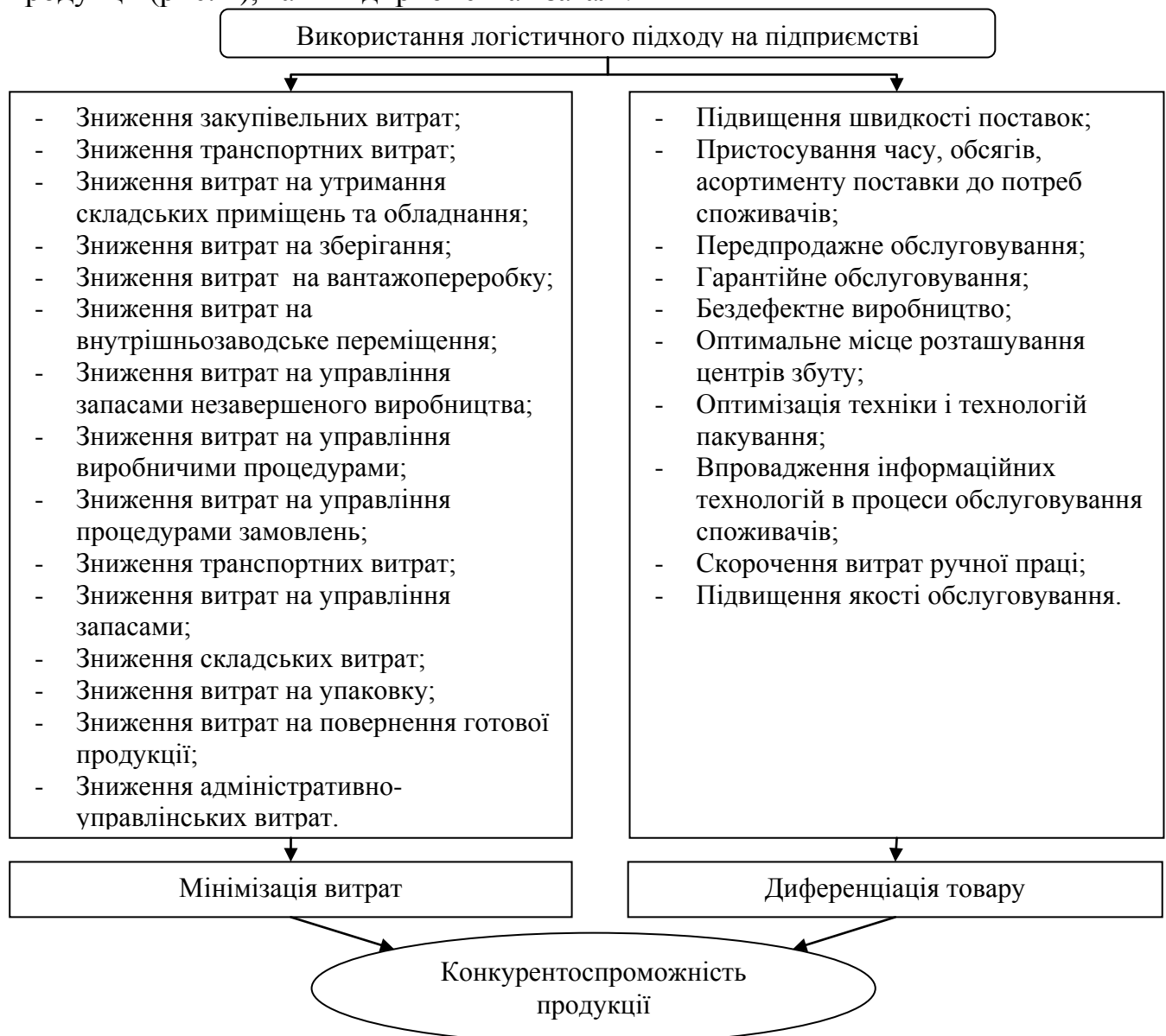
Рис 1. Напрями досягнення конкурентних переваг продукції за рахунок використання логістичного підходу

Таким чином, використання інтегруючого логістичного підходу дає змогу підприємству забезпечити досягнення певних конкурентних переваг як продукції (рис. 1), так і підприємства взагалі.