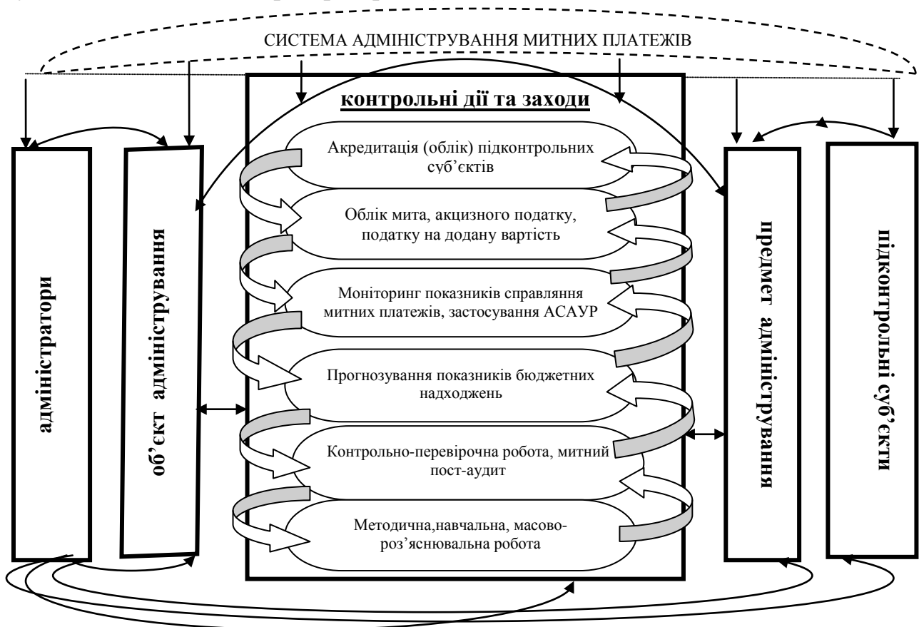
Рис. 1. Механізм функціонування системи адміністрування митних платежів

Цілісність механізму забезпечується завдяки комплексу взаємообумовлених та взаємопов'язаних процесів, які виступають функціональними елементами адміністрування митних платежів, що регламентують виконання обов'язків, застосування прав як підконтрольних суб'єктів, так і адміністраторів (рис.1).